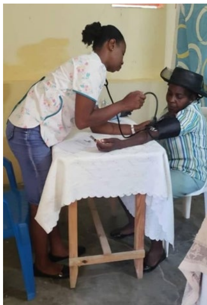
Foto de una clínica médica funcionando en nuestra misión en Haití.